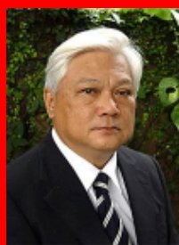
チャヤン ・ヴァダナプティ 教授

一方で、高等教育機関においては、従 来の学問体系の枠組みを維持しつつも、 複合領域的な学びの機会の創出が試 みられている。「持続可能な社会」とい う国連が提示した考え方に、大学はど う向かい合うのか。本シンポジウムでは、 国内外の高等教育機関でESDに取り組 む専門家を招聘し、この問いについて 議論したい。」