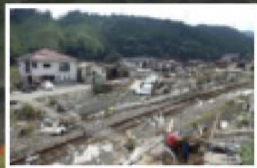
①茶屋地区被災状況