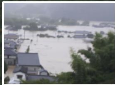
⑤山口地区浸水状況