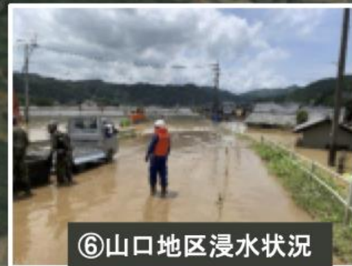
⑥山口地区浸水状況