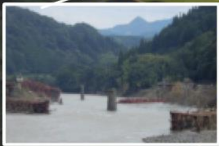
②道路橋及びJR橋の被災状況