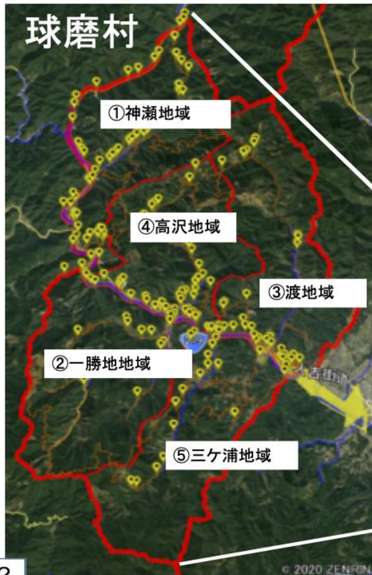
球磨村の位置図および被災状況